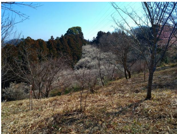
東園 送電線鉄塔付近から