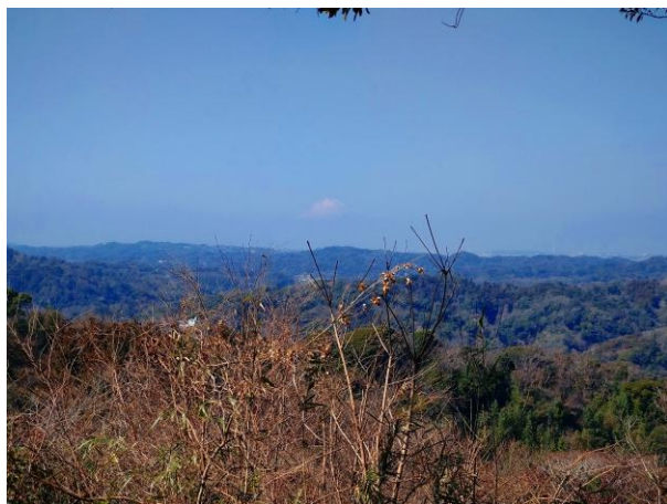
本日の富士山 展望台から