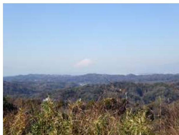
本日の富士山 展望台から (今日はよく見えます)