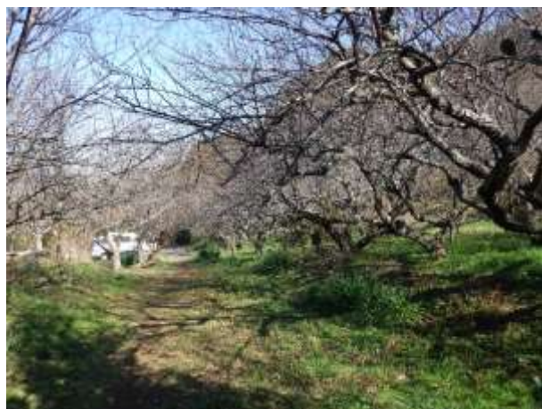
西園 散策路中ほどから