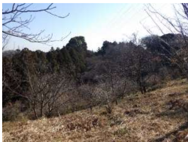
東園 送電線鉄塔付近から