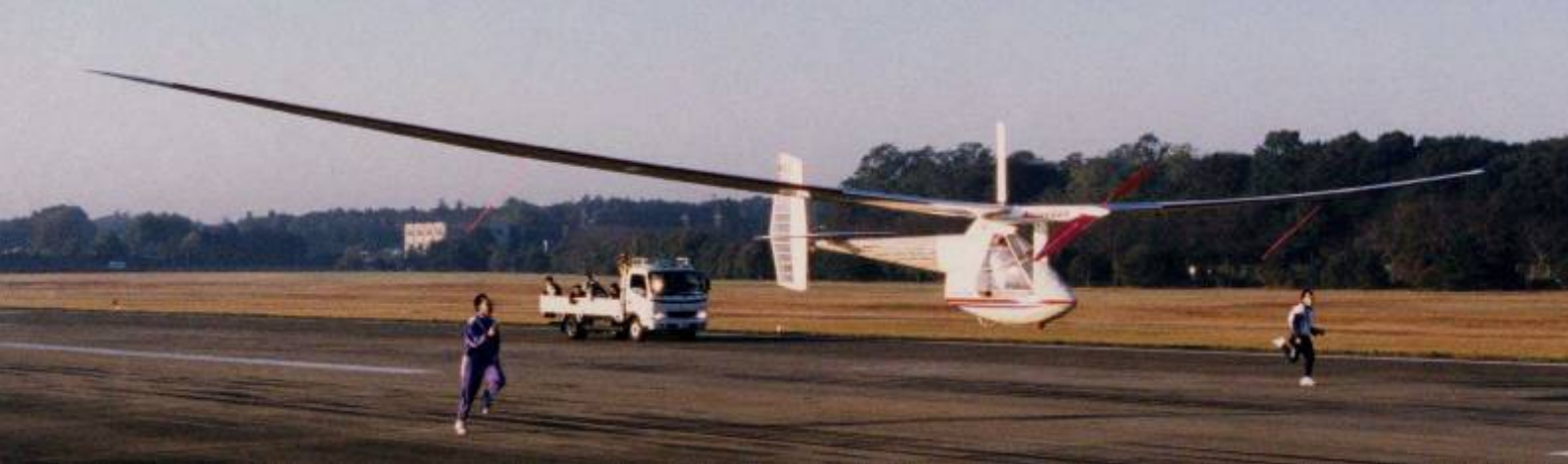
世界中から大きな評価を得た“CHicK-2000”の記録飛行 2000年11月4日 於：航空自衛隊下総航空基地