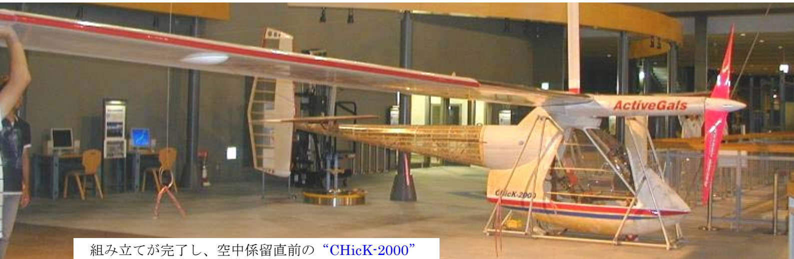
組み立てが完了し、空中係留直前の“CHicK-2000”