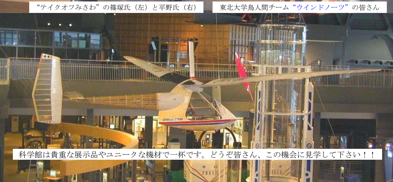
科学館は貴重な展示品やユニークな機材で一杯です。どうぞ皆さん、この機会に見学して下さい！！